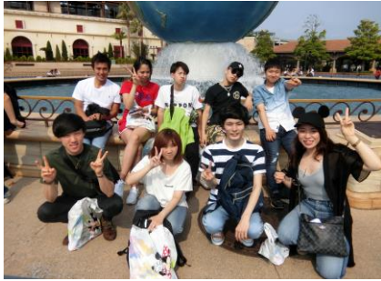
遠足(ディズニーシー)