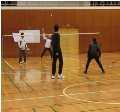
球技大会(バドミントン)