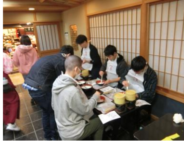
修学旅行(体験活動(ハッ橋作り)・京都)