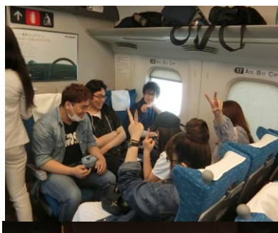
修学旅行 (広島・大阪・京都)